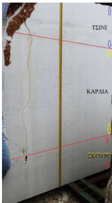
εικ.1: "Σπέσιαλ Κληματιάς"